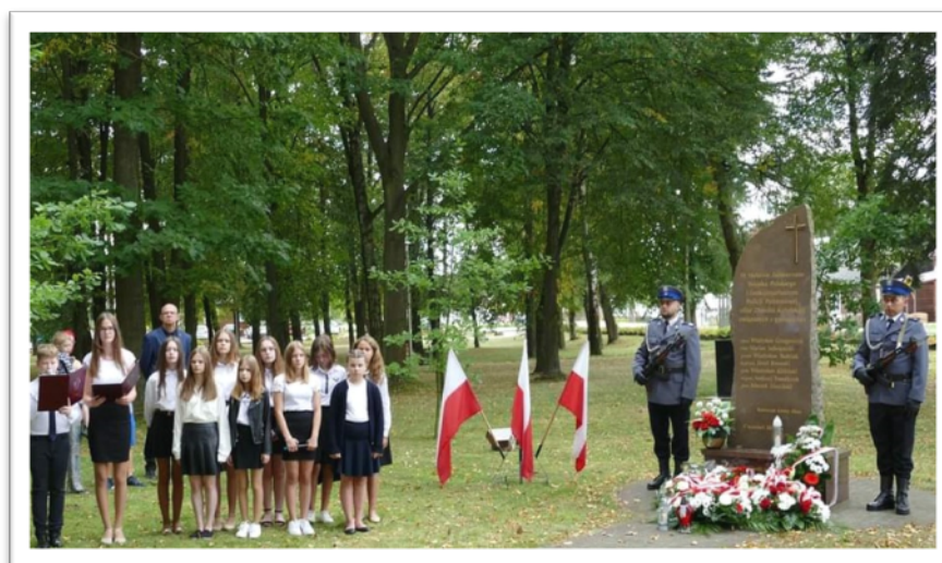
17 września 2023 - uroczystości ku czci żołnierzy Wojska Polskiego i funkcjonariuszy Policji Państwowej pomordowanych w Katyniu, Charkowie, Twerze-Miednoje

We wrześniu 2022 r. za zgodą Świętokrzyskiego Wojewódzkiego Konserwatora Zabytków w Kielcach wyspecjalizowana firma przeprowadziła prace konserwatorskie polegające na wykonaniu zabiegów pielęgnacyjnych w obrębie korony 1 drzewa gatunku dąb szypułkowy, rosnącego na terenie pozostałości parku w Zakrzowie wpisanego do rejestru zabytków nieruchomych woj. świętokrzyskiego pod nr. 131.