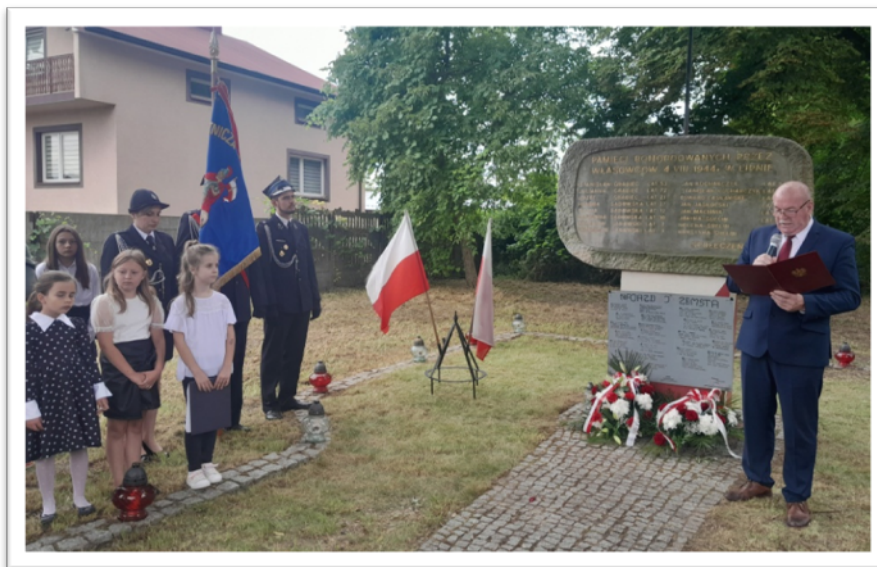
4 sierpnia 2023 r. - uroczystości upamiętniające mieszkańców Lipna pomordowanych przez własowców w dniu 4 sierpnia 1944 r.

Szczególną wagę przywiązuje się do dbałości o miejsca pamięci narodowej upamiętniające ważne wydarzenia historyczne. Corocznie odbywają się uroczystości upamiętniające te wydarzenia.