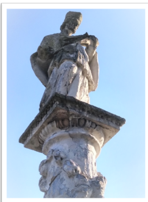
Figura św. Jana Nepomucena - stan przed renowacją