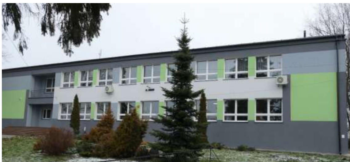
Budynek Szkoły Podstawowej w Oksie