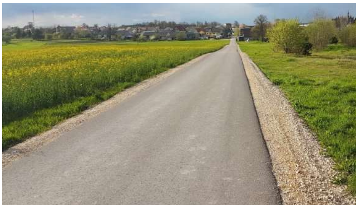
Droga Węgleszyn - Węgleszyn-Ogrody