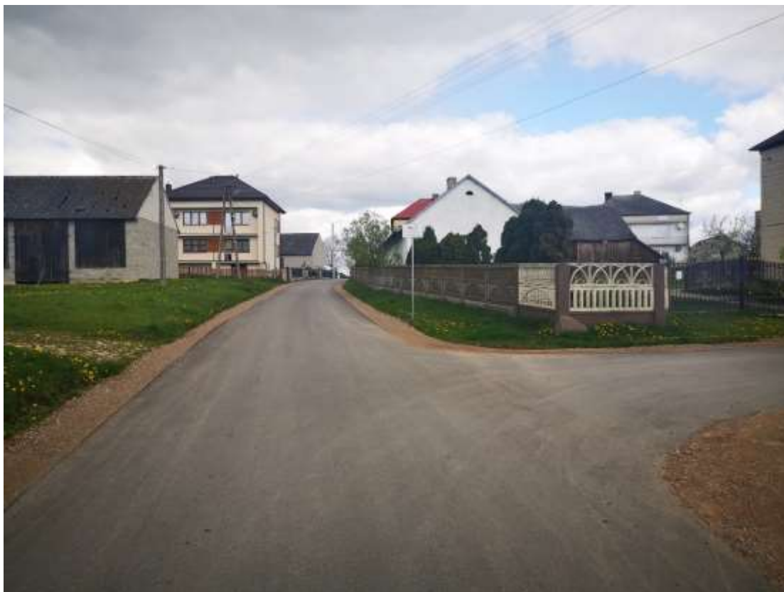
Droga w miejscowości Zakrzów