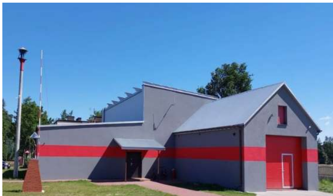
Budynek w Nowych Kanicach