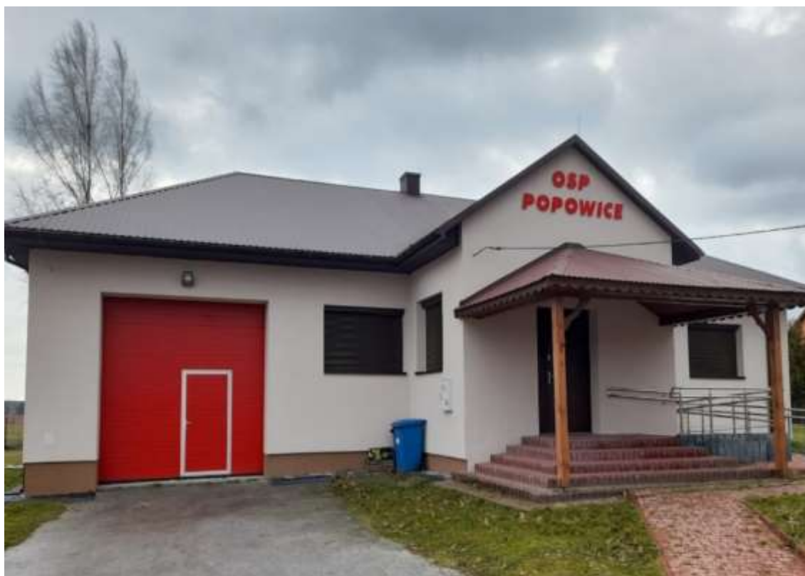
Budynek OSP Popowice