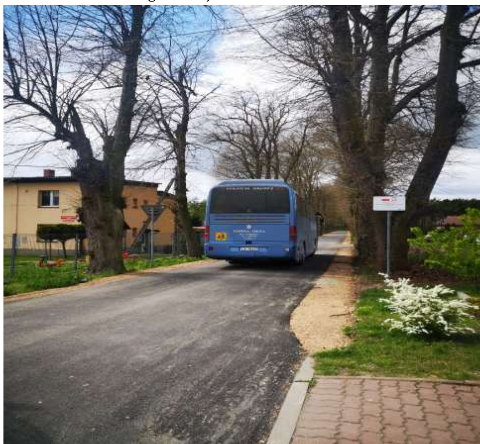
Droga w miejscowości Oksa