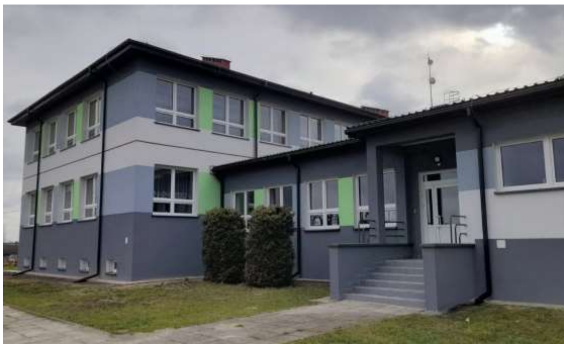
Budynek Szkoły Podstawowej w Węgleszynie