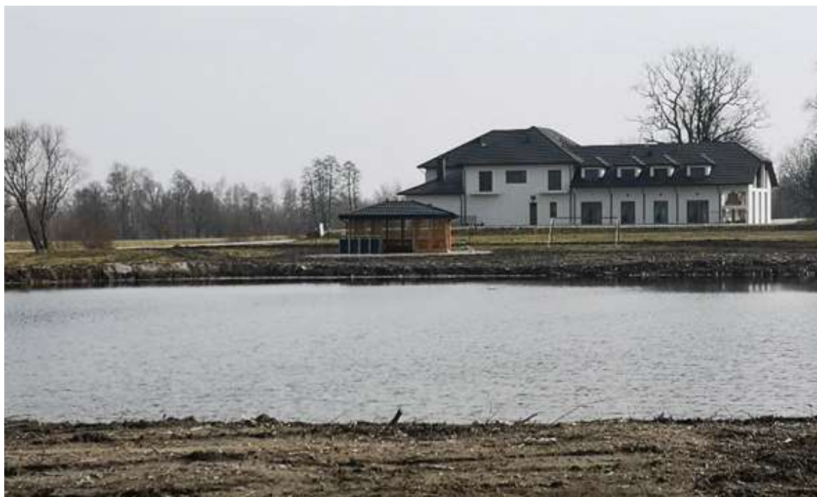
Altana przy stawie Zakrzów

Wyłoniono wykonawcę na realizację zadania: „Budowa przydomowych oczyszczalni ścieków na terenie Gminy Oksa w systemie zaprojektuj i wybuduj”. Za kwotę 2 374 256,70 zł przewiduje się realizację 111 przydomowych oczyszczalni ścieków z terminem realizacji do sierpnia 2023r.