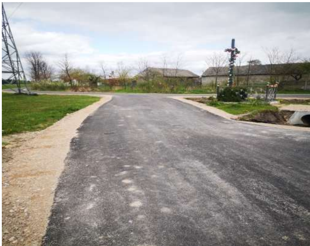
Droga w miejscowości Rembiechowa