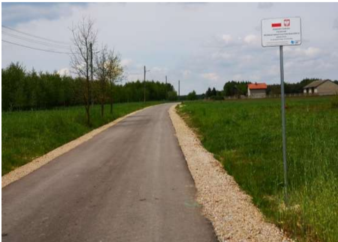
Droga wewnętrzna w miejscowości Rzeszówek