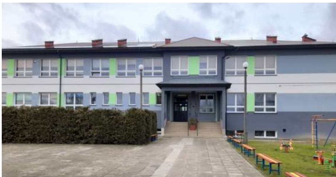
Budynek Szkoły Podstawowej w Węgleszynie