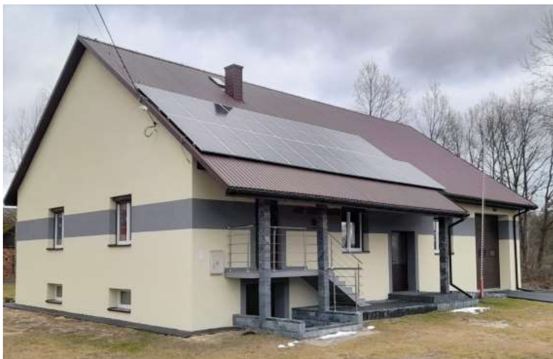
Budynek OSP w Rzeszówku