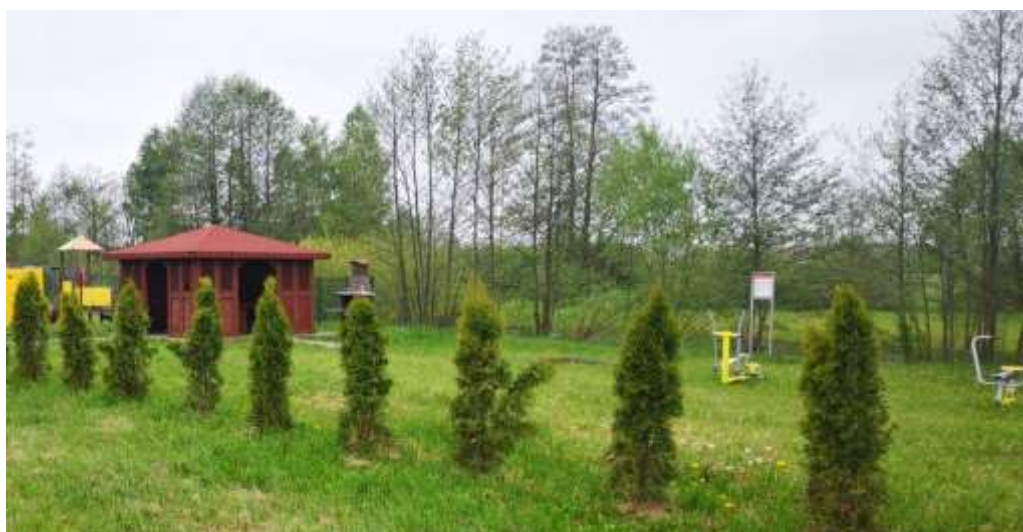
Wymiana urządzeń oraz nasadzenie roślin ozdobnych na placu zabaw w miejscowości Zalesie