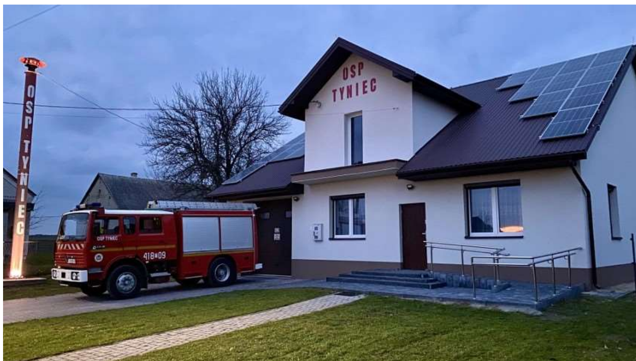
Budynek OSP w Tyńcu