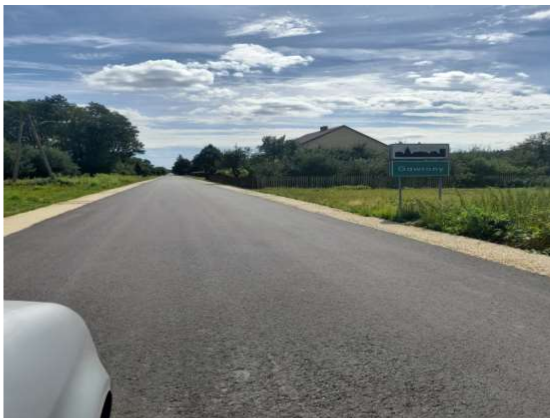
Droga gminna w miejscowości Gawrony.