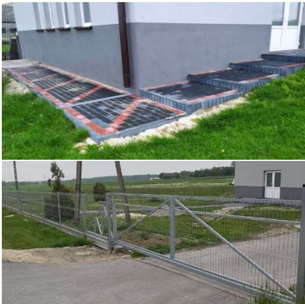
Ogrodzenie oraz chodnik przy remizie OSP Błogoszów