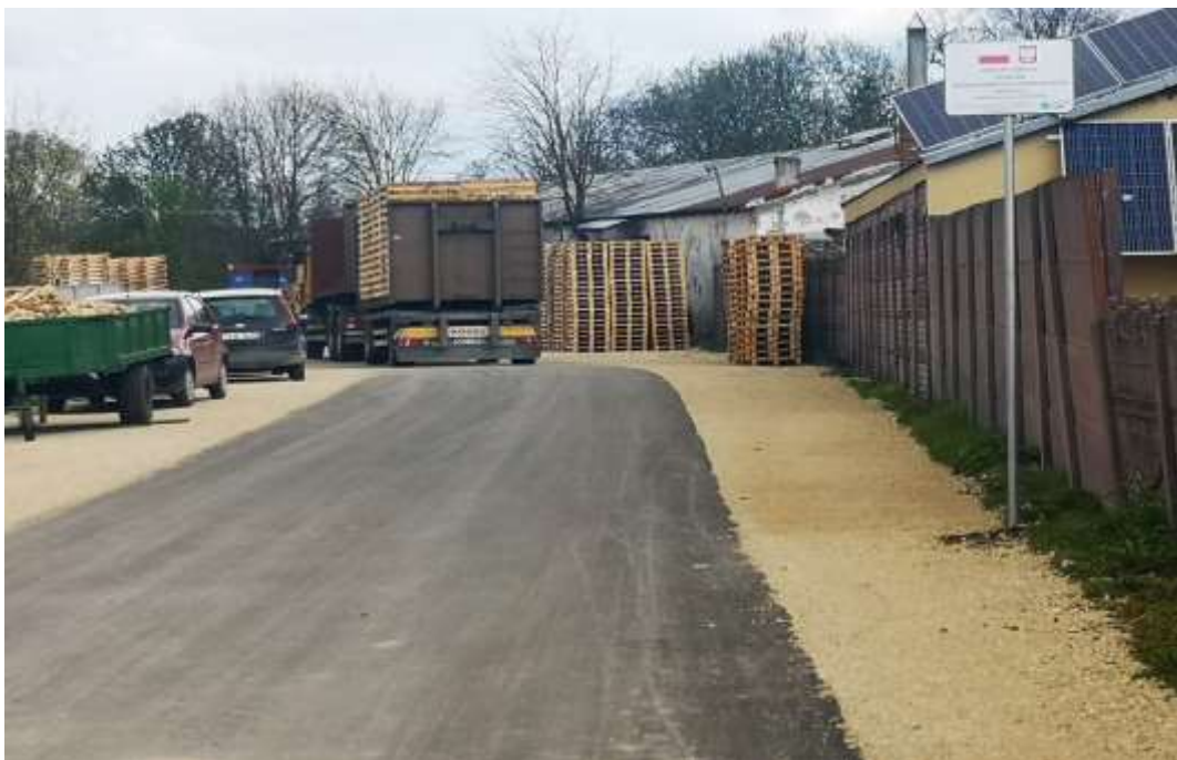
Droga w miejscowości Lipno

Ponadto wykonano Przebudowę drogi dojazdowej do pól w m. Lipno położonej na dz. 904/1, 957, 1149/2, 1200/12” za cenę 227 550,00 zł.