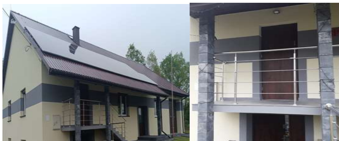
Wykonanie barierki przy remizie OSP Rzeszówek