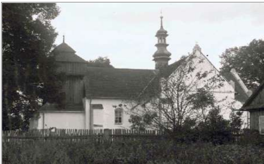
Dawny zbór kalwiński Rejów.

się synody protestanckie. W 1678 został przejęty przez cystersów jędrzejowskich i został filią parafii Konieczno.