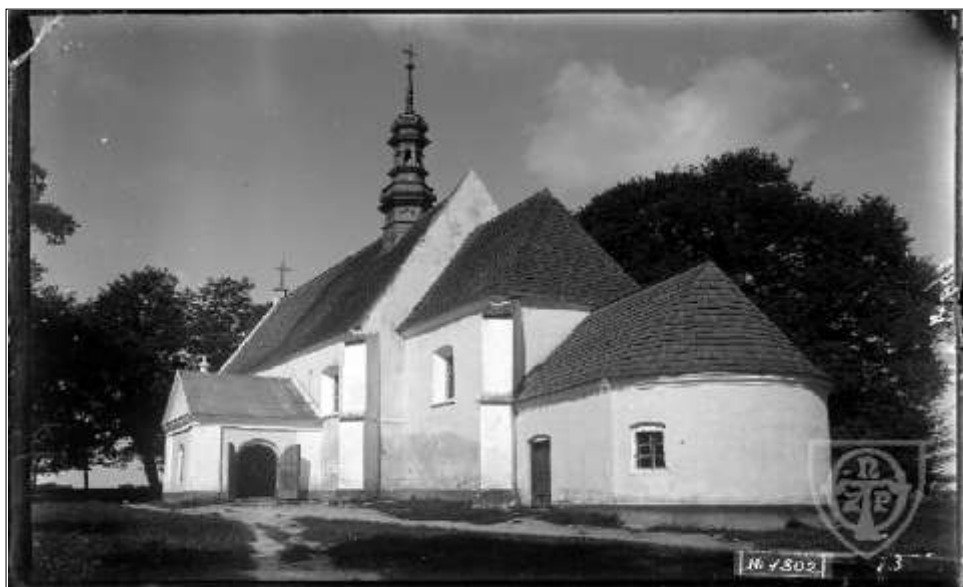
Lata 1905-1910