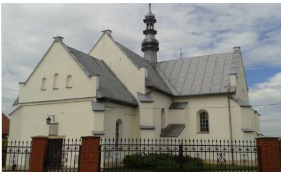
Widok obecny od strony ptn. - wsch.

Fotografia Kazimierza Broniewskiego z około 1914 roku. Źródło: pl.wikipedia.org