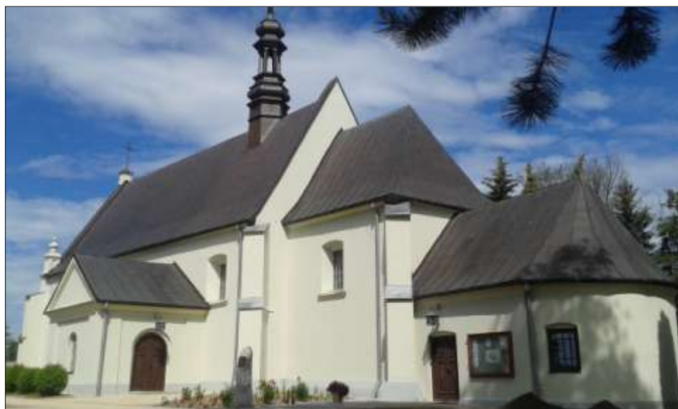
Widok obecny od strony pfd. - wsch.

Wyróżnić należy również zabytki stanowiące uzupełnienie zespołu kościoła parafialnego, jako obiekty decydujące o kontekście przestrzennym i architektonicznym cennego zabytku wpisanego do rejestru zabytków: