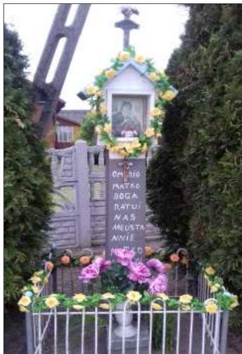
Kapliczka we wsi Węgleszyn