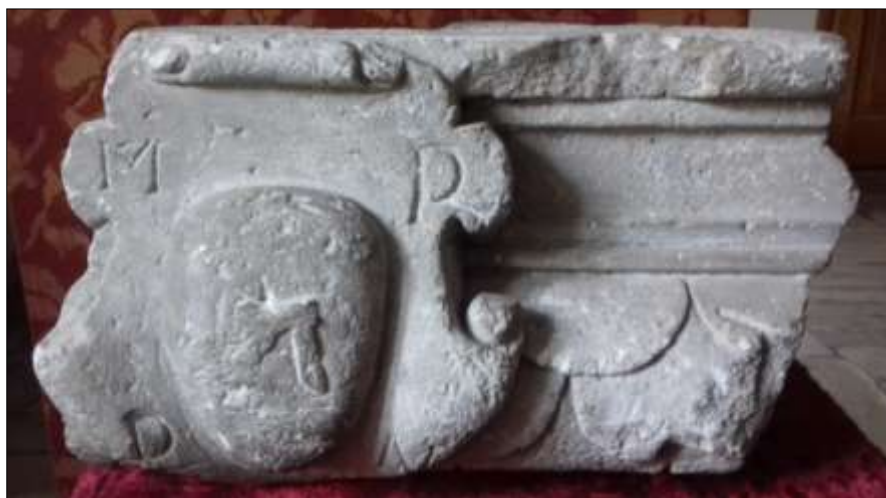
Kartusz herbowy poety