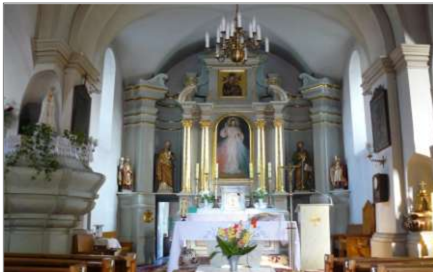
Wystrój kościoła - ołtarz główny