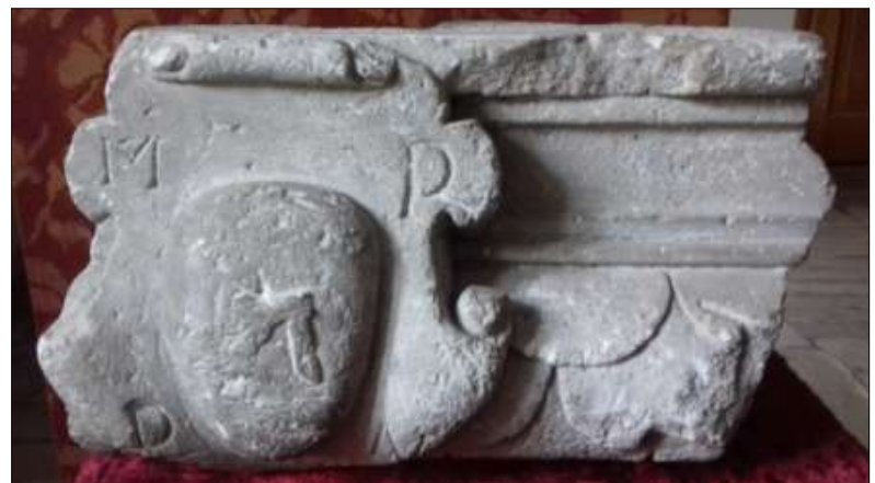
Kartusz herbowy wykopany przy ul. Jędrzejowskiej w Oksie