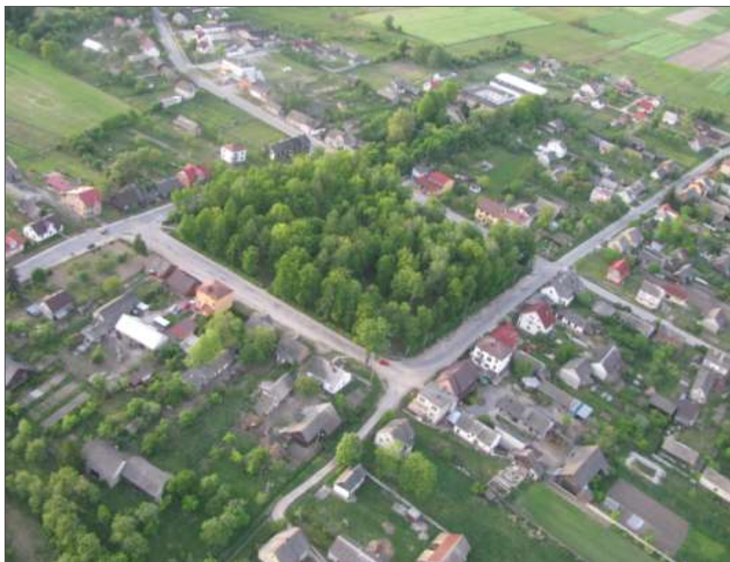
Widok z lotu ptaka. Autor: Paweł Wicher

Założone przez Mikołaja Reja miasto Oksza od zwykłej wsi różniło się tym, że miało prawa miejskie oraz wielki czworoboczny rynek i wieloboczny układ osady.