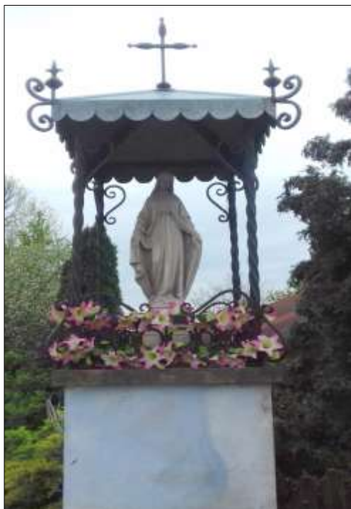
Kapliczka we wsi Popowice

Poniżej fotografie kilku kapliczek, figur i krzyży z terenu gminy: