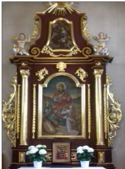
Ołtarz od strony północnej

Kościół ma sklepienie beczkowe. U wejścia znajduje się przedsionek, a nad nim wznosi się drewniana dzwonnica. Chór oparty jest na dwóch słupach drewnianych, posiada organy o dziewięciu głosach. Nad wejściem głównym do kościoła widoczny jest kamienny kartusz z herbem Rejów – Okszą.