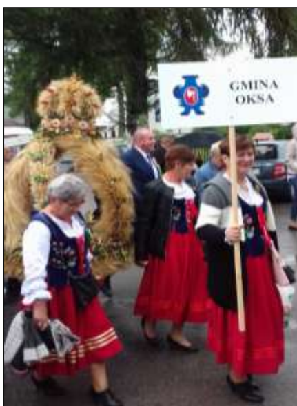
Korowód dożynkowy- Sobków, 2018 r.