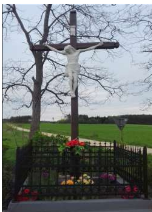
Krzyż w Popowicach