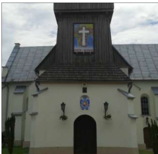
Wejście główne do kościoła

Kościół ma sklepienie beczkowe. U wejścia znajduje się przedsionek, a nad nim wznosi się drewniana dzwonnica. Chór oparty jest na dwóch słupach drewnianych, posiada organy o dziewięciu głosach. Nad wejściem głównym do kościoła widoczny jest kamienny kartusz z herbem Rejów – Okszą.