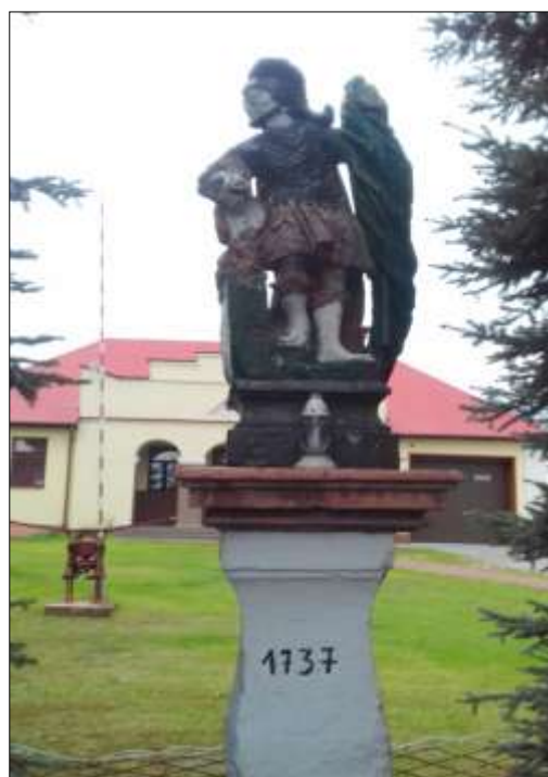
Figura św. Floriana w Oksie