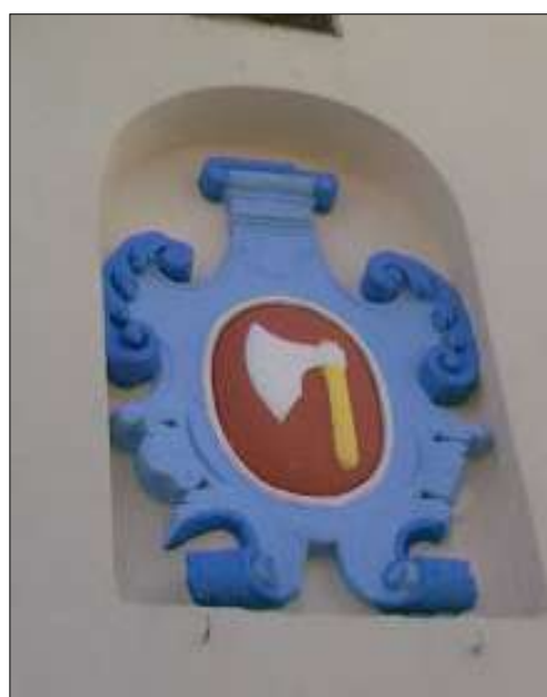
Kamienny kartusz herbowy