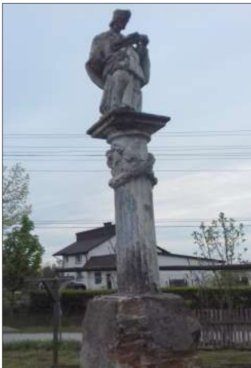
Figura św. Nepomucena w Węgleszynie