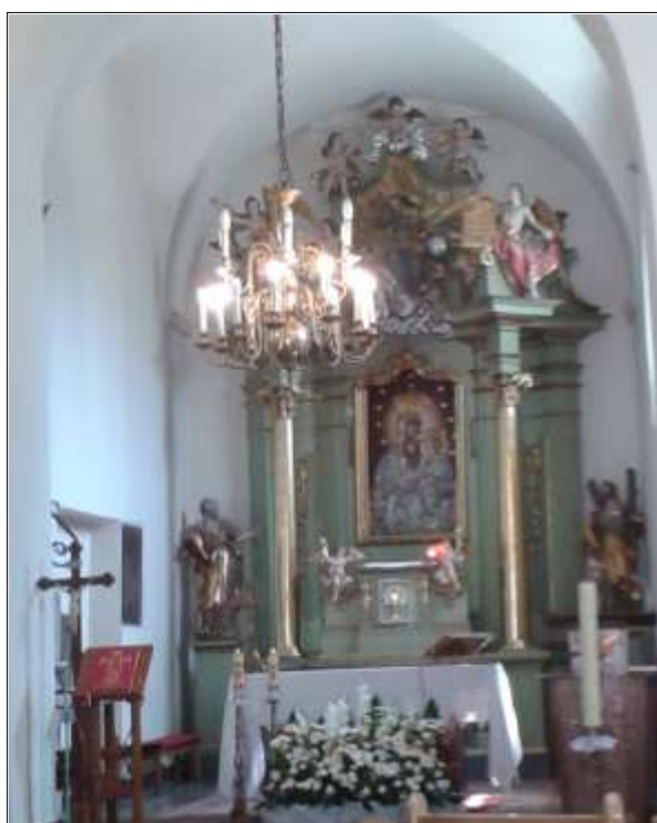
Wystrój kościoła – ołtarz główny

Ze względów bezpieczeństwa nie publikuje się szczegółowych danych dotyczących zabytków ruchomych. Ich stan zachowania jest z reguły bardzo dobry - poddawane są bieżącym konserwacjom.