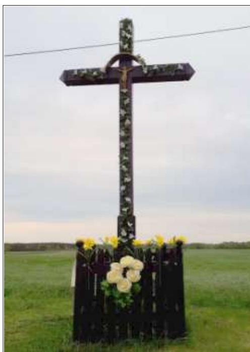
Krzyż w Błogoszowie - Kolonia Las