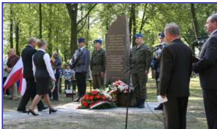
Uroczyste poświęcenie i odsłonięcie obelisku oraz posadzenie 7 „Dębów Pamięci”