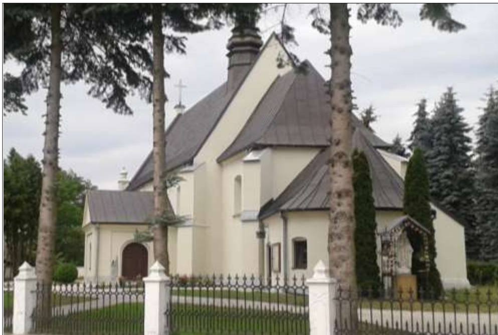
Widok ogólny od strony drogi powiatowe

„Słownik Geograficzny Królestwa Polskiego” z 1884 r., t. V podaje m.in.: Osiedlił się tu w XIV w. ród szlachecki hrabiego Jelita z Morska w Wieluńskim (...). Florian z Morska, biskup krakowski (1366-1380) wystawił w miejscu istniejącego już tu kościoła drewnianego nowy, murowany pw. św. Andrzeja. Data powstania węgleszyńskiej parafii nie jest znana.