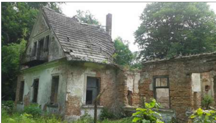
Fragment skrzydła od strony dawnego folwarku