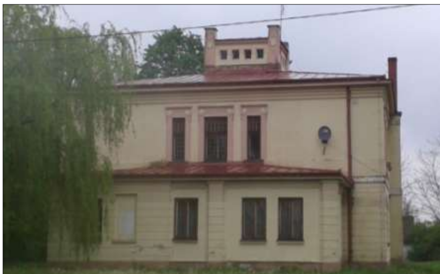
Elewacja ptd. - zach.

Po 1945 r. mieściła się w nim szkoła, mieszkania lokatorskie, później przedszkole. Od września 2014 r. budynek nie jest użytkowany i niszczeje.