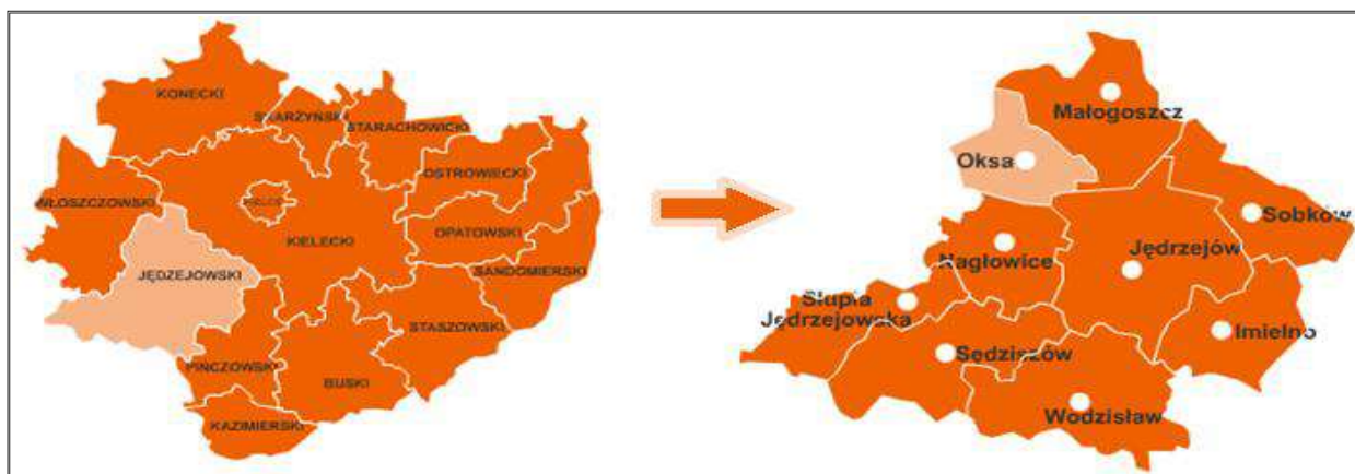
Położenie gminy na tle województwa i powiatu.

Gmina Oksa położona jest w zachodniej części województwa świętokrzyskiego w pn.- zach. części powiatu jędrzejowskiego. Powierzchnia Gminy wynosi 91 km 2 , co stanowi 0,8% powierzchni województwa oraz 7,2% powierzchni powiatu.