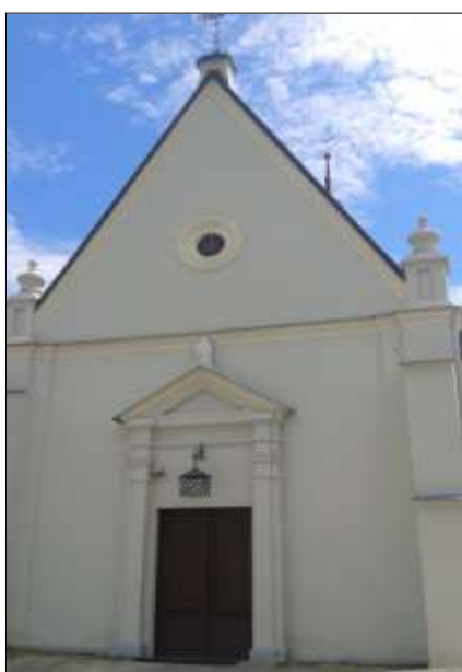
Wejście główne do kościoła

W jego centralnej części znajduje się obraz Matki Boskiej z Dzieciątkiem, pochodzący z ok. 1700 r. Matka Boża Szkaplerzna z Węgleszyna jest otoczona wielką czcią. Dotąd zachowała się tradycja tłumnych odpustów 16 lipca.