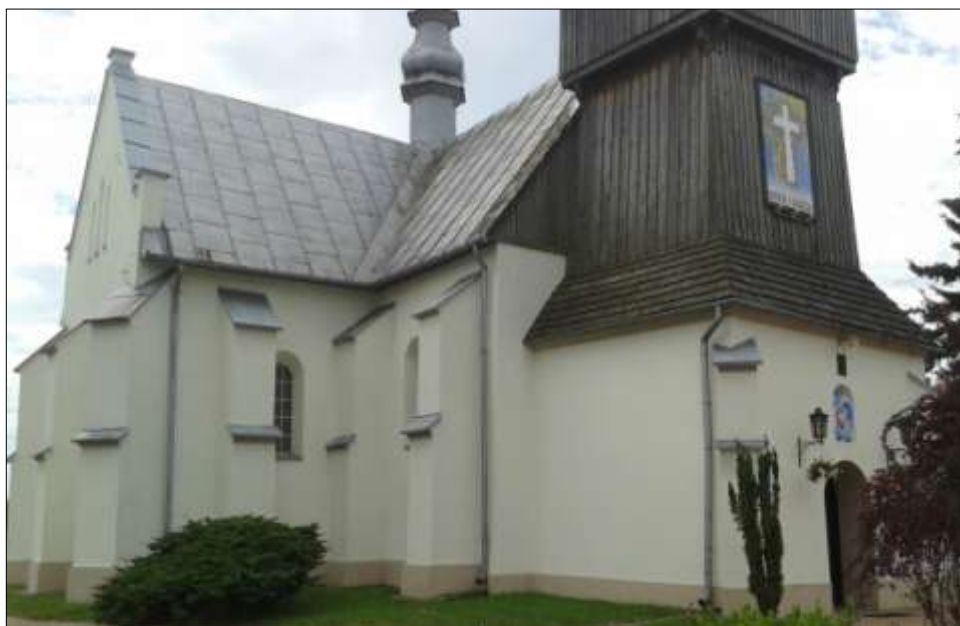
Elewacja od strony półn. - zach.

Kościół jest przepiękną i najbardziej oryginalną, autentyczną pamiątką z czasów Mikołaja Reja i jego syna Andrzeja, stąd szczególna troska proboszcza oraz parafian o zachowanie go w jak najlepszym stanie dla przyszłych pokoleń.