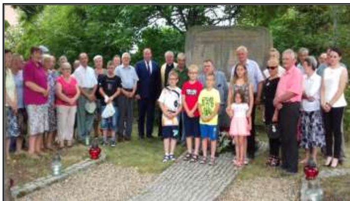
Uroczystości upamiętniające pomordowanych w dniu 4 sierpnia 1944 r. mieszkańców Lipna

W dniu 17 września 2012 r. w Oksie poświęcono i odsłonięto obelisk oraz posadzono 7 „Dębów Pamięci”, upamiętniających żołnierzy Wojska Polskiego i Funkcjonariuszy Policji Państwowej - ofiar Zbrodni Katyńskiej związanych z gminą Oksa.