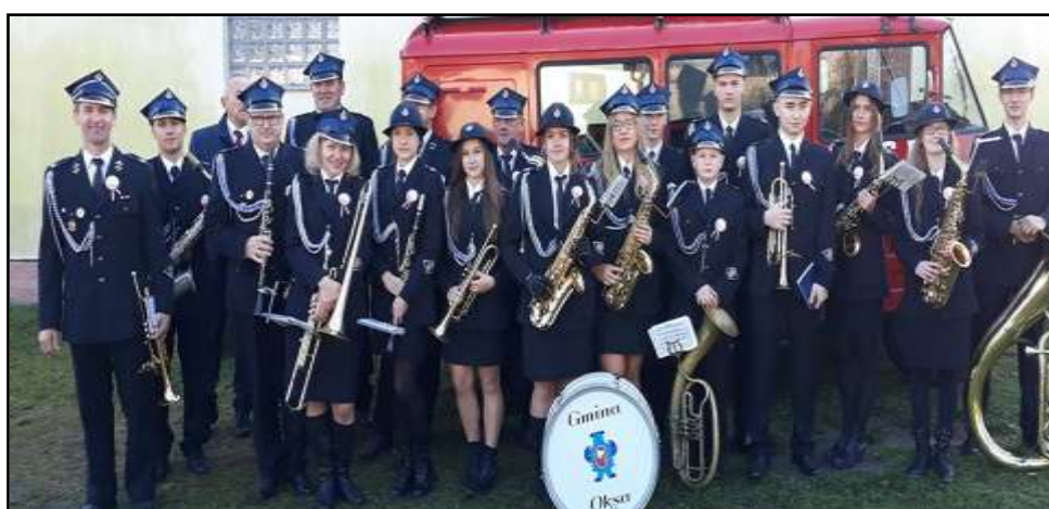
Orkiestra dęta z Zakrzowa

Od kilku lat na terenie gminy działa orkiestra dęta, która swymi występami uświetnia uroczystości patriotyczno – kościelne.