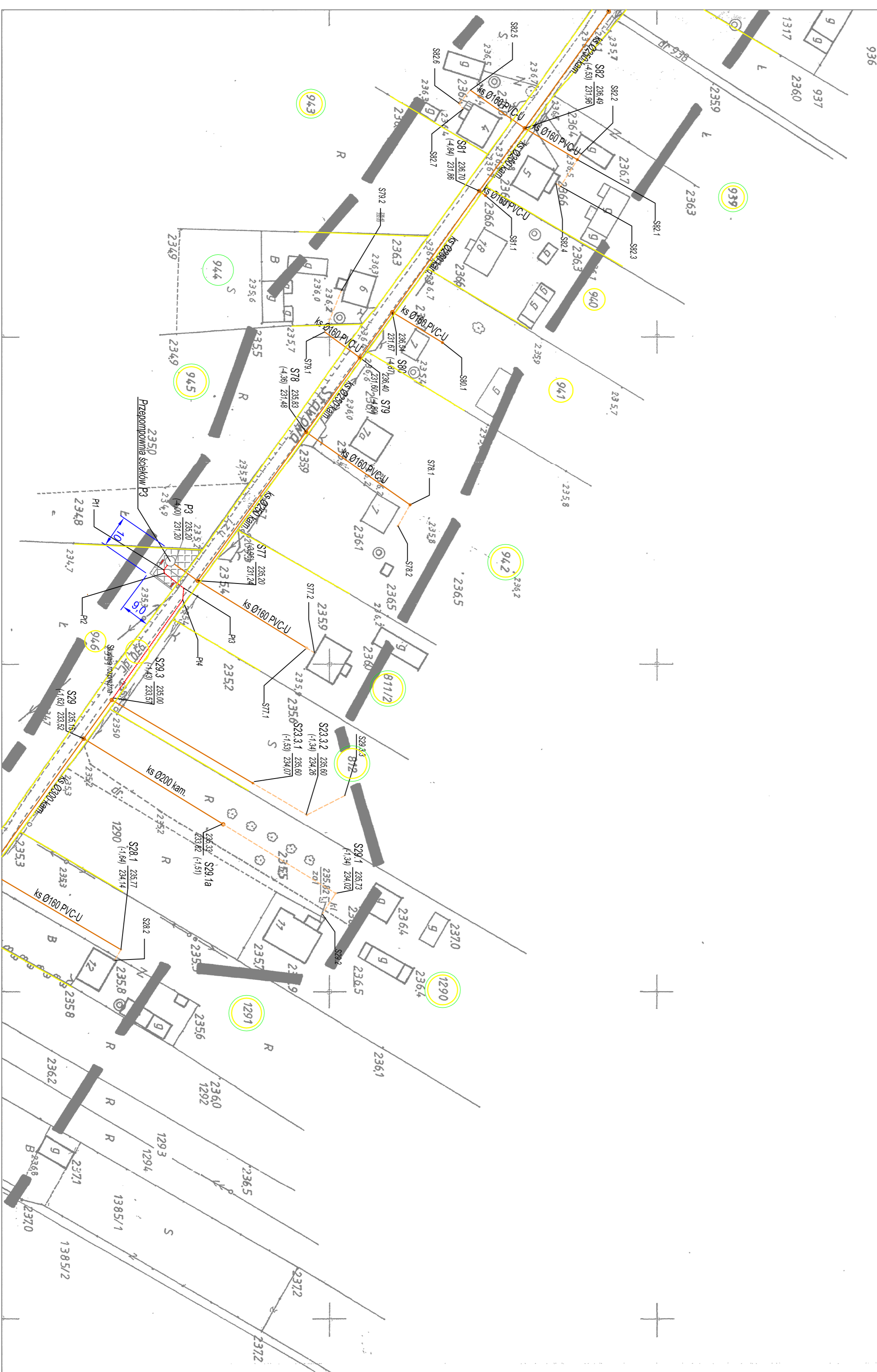
plan nr 6